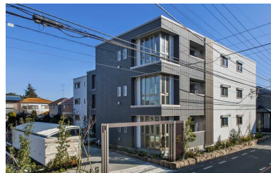
駅近、築浅、積水ハウスのシャーマン 沢山ありマスト。